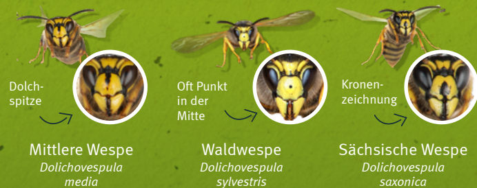
Mittlere Wespe Dolichovespula media