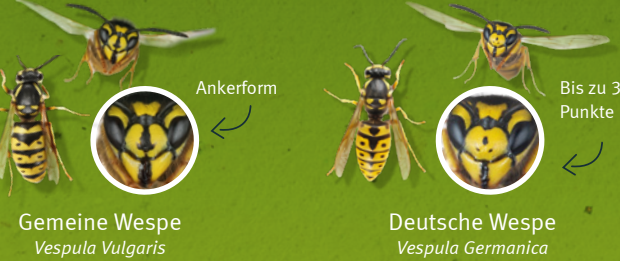
Gemeine Wespe Vespa vulgaris