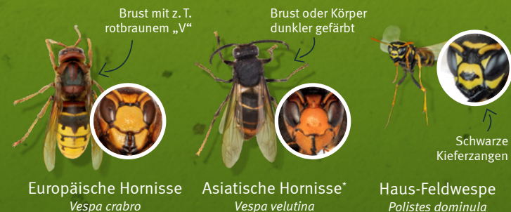
Europäische Hornisse Vespa crabro