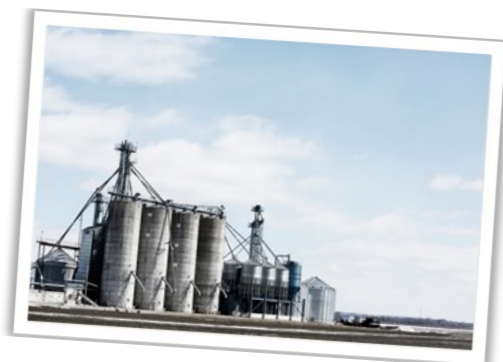
Erdgas kommt auch in der Industrie zum Einsatz

Neu geschaffene Transport- und Speichermöglichkeiten (z.B. LNG-Terminals und Gasnetzanbindung) binden viel Geld, das wir für den Umbau zu einer echten erneuerbaren Energieversorgung dringend benötigen!